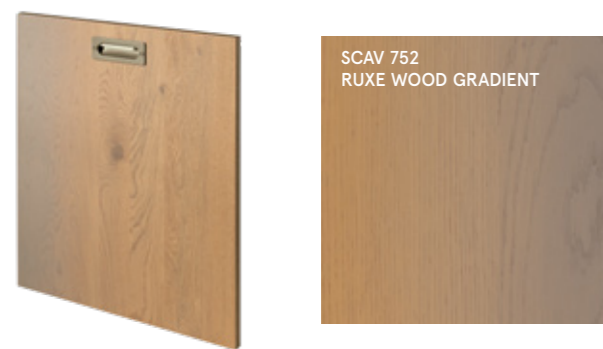
SCAV 752 RUXE WOOD GRADIENT

ANTA IMPIALLACCIATA SP. 2,2 CM . 2.2 cm thick veneered door . Porte Plaqué ép. 2,2 cm . Furnierte Front St. 2,2 cm . Puerta enchapada esp. 2,2 cm . Створка с отделкой шпоном т. 2,2 см . 实木贴皮门板,厚2.2cm