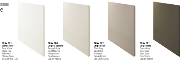
SCAV 021 Bianco Puro Pure White Blanc Pur Reinweiß Bianco Puro Белый Чистый