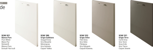
SCAV 021 Bianco Puro Pure White Blanc Pur Reinweiß Bianco Puro Белый Чистый