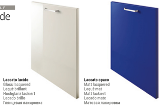
Laccato lucido Glass lacquered Laque brillant Hochglanz lackiert Lacado brillo Глянцевая лакировка