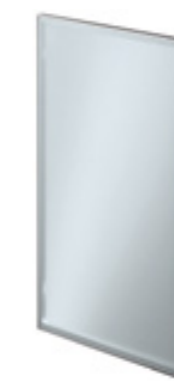
Vetro e telaio Alluminio (senza maniglia per soluzione Flat Line) Glass and Aluminium frame (without handle for the Flat Line solution) Verre et cadre Aluminium (sans poignée pour solution Flat Line) Glas und Alu-Rahmen (ohne Griff für die Flat Line Lösung) Cristal y bastidor de Aluminio (sin tirador para solución Flat Line) Стекло и рама из алюминия (без ручки для решения Flat Line)