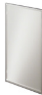
Vetro coprente e telaio Alluminio (senza maniglia per soluzione Flat Line) Non-transparent glass and Aluminium frame (without handle for the Flat Line solution) Verre couvrant et cadre Aluminium (sans poignée pour solution Flat Line) Deckglas und Alu-Rahmen (ohne Griff für die Flat Line Lösung) Cristal esmerilado y bastidor de Aluminio (sin tirador para solución Flat Line) Стекло непрозрачное и рама из алюминия (без ручки для решения Flat Line)

Spessore anta 2,1/2,2 cm Door thickness 2.1/2.2 cm Épaisseur porte 2,1/2,2 cm Frontstärke 2,1/2,2 cm Espesor puerta 2,1/2,2 cm Толщина створки 2,1/2,2 см