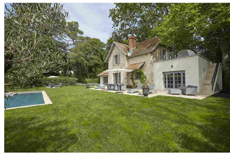
Le strutture del castello sono indipendenti e completamente attrezzate

Immerso tra gli infiniti vigneti della Languedoc , lo splendido castello - che comprende 17 ettari di giardino e parco - è stato completamente restaurato ed oggi offre otto camere d'albergo in perfetto stile francese e 36 eleganti residenze private ricavate dalle dipendenze originali del castello, con superfici comprese tra 85 e 130 mq . Tutte le strutture sono indipendenti e completamente attrezzate : ognuna dispone di un curato spazio esterno - con giardino o terrazza e, per alcune ville, di piscina privata riscaldata - che consente vivere anche all'aperto sfruttando al massimo il mite e soleggiato clima mediterraneo.