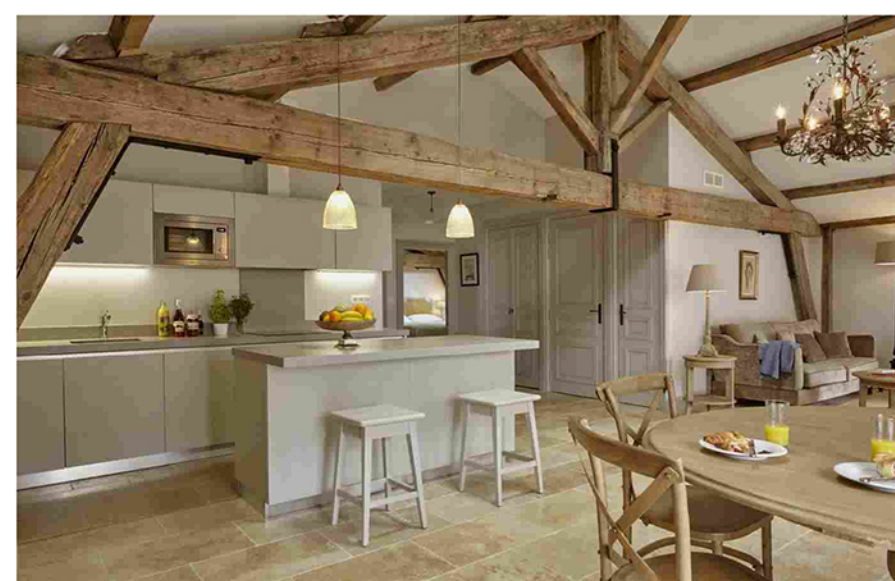
Una delle suggestive cucine Scavolini create per il casello francese

Ognuna delle esclusive residenze mixa sapientemente comfort e design all'insegna della massima personalizzazione - le tre linee creano inedite suggestioni dal mood cosmopolita , in un perfetto equilibrio tra estetica e funzionalità .