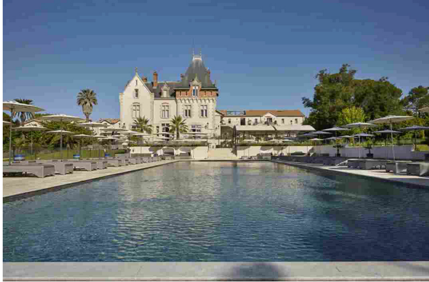
Il castello francese St Pierre de Serjac

Home > Progetti > Contract > Le cucine di Scavolini in un castello francese