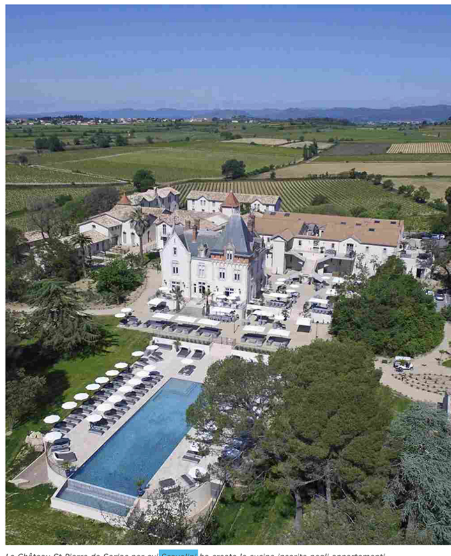
Lo Château St Pierre de Serjac per cui Scavolini ha creato le cucine inserite negli appartamenti.

Una straordinaria referenza Scavolini nel Sud della Francia: si tratta dello Château St Pierre de Serjac , incantevole tenuta che sorge nella campagna mediterranea del sud della Francia per cui Scavolini ha scelto tre collezioni cucina per i 36 esclusivi appartamenti della tenuta .